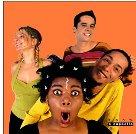
Le Chant des possibles

Ce spectacle fait partie de la Biennale d'art vocal