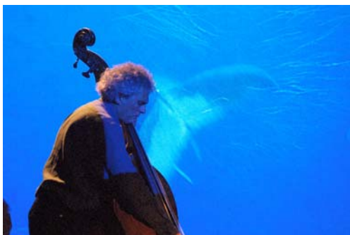
Baleine et Contrebasse

MERCREDI 29 AVRIL, 15H JEUDI 30 AVRIL, 10H ET 14H30