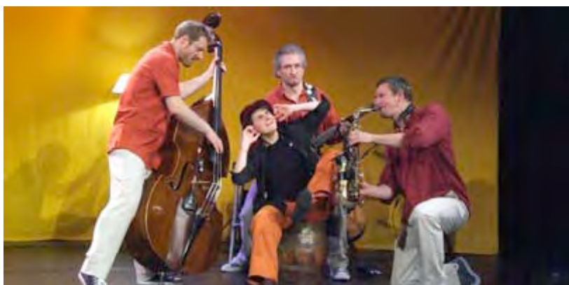
Si la terre...