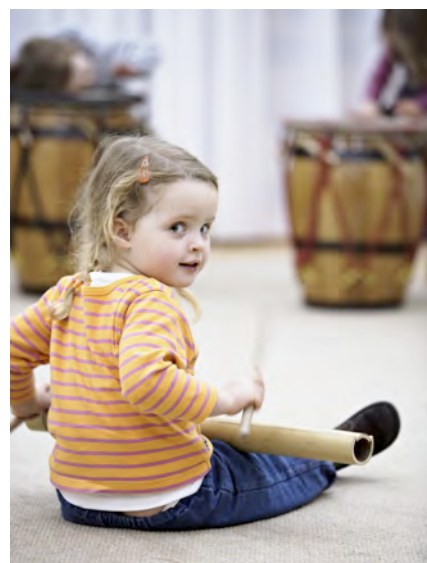
© Pleutin PFEIFFER / CITE DE LA MUSIQUE