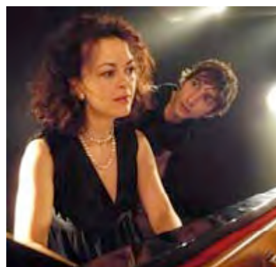
Un piano qu'on sert... tôt