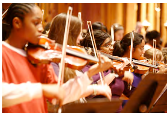
Take a bow!

Samedi 30 Janvier Samedi 20 Mars Samedi 10 Avril Samedi 1 er Mai Samedi 12 Juin Lundi 21 Juin Mardi 22 juin Mercredi 23 Juin