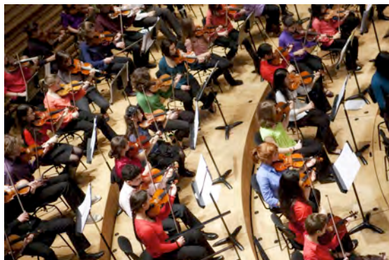
Take a bow! Salle Pleyel en février 2009