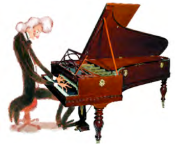
Le piano de Chopin

Réalisée en coproduction avec la Bibliothèque nationale de France, l'exposition célèbre le bicentenaire de la naissance du pianiste et compositeur, en offrant un regard nouveau sur sa création. Manuscrits et éditions rares, tableaux, dessins et instruments permettent de pénétrer au cœur de « l'atelier de Chopin », de montrer comment Chopin y croise artistes, écrivains et journalistes comme notamment Delacroix et George Sand.