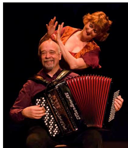
Cocodi ©Jean-Louis Duzert