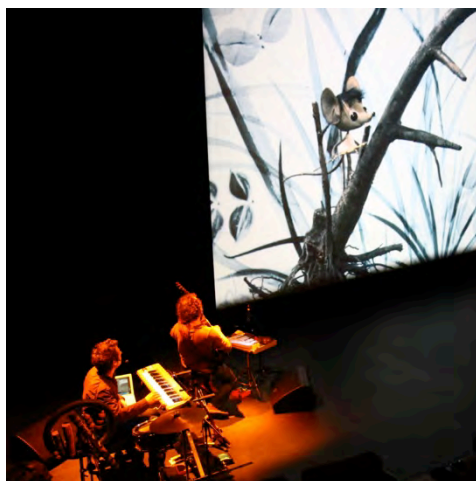
Filopat et Patafil

Ce spectacle fait partie de la thématique Musique et cinéma