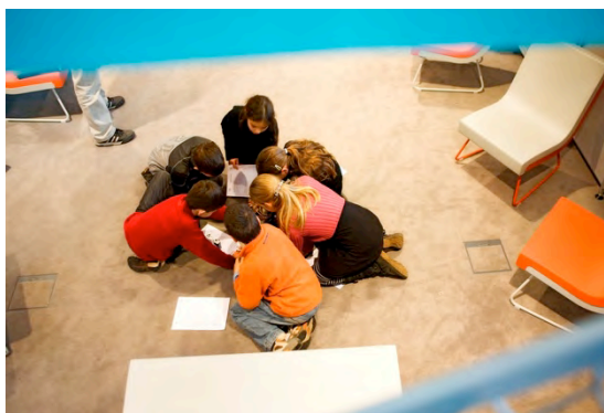
Balade autour d'un instrument