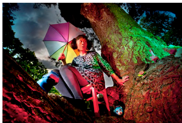
Le village des petites boucles

Ce spectacle fait partie de la thématique En boucle .