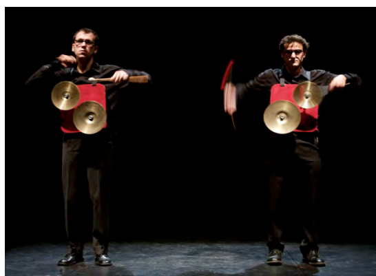
Brève rencontre