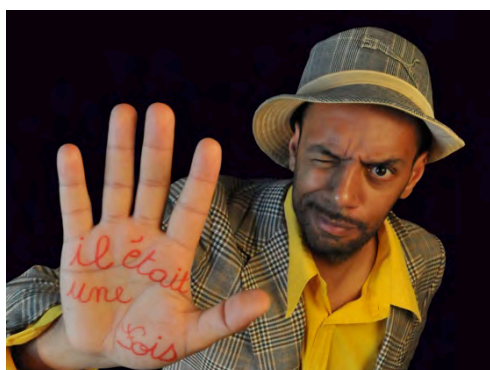
Conte & Soul