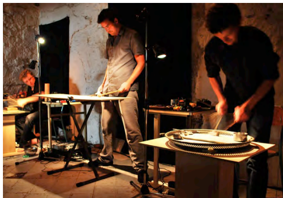
Les Phasmes

Les phasmes sont des insectes herbivores. Ils se fondent dans leur environnement pour survivre, en imitant à la perfection brindilles et feuilles mortes. Mais ici, Les Phasmes , ce sont de drôles de bêtes : trois cerveaux, six bras, six mains, une vingtaine de pieds (de cymbales), des plaques de tôle, des casseroles, des aiguilles à tricoter, un arsenal d'objets sans queues ni têtes, mais subtilement sonore... Grâce à la magie du spectacle, Les Phasmes transforment tout ce bric-à-brac en une musique sans cesse renouvelée.