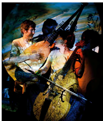
Concerto Luminoso © Mustapha Azeroual