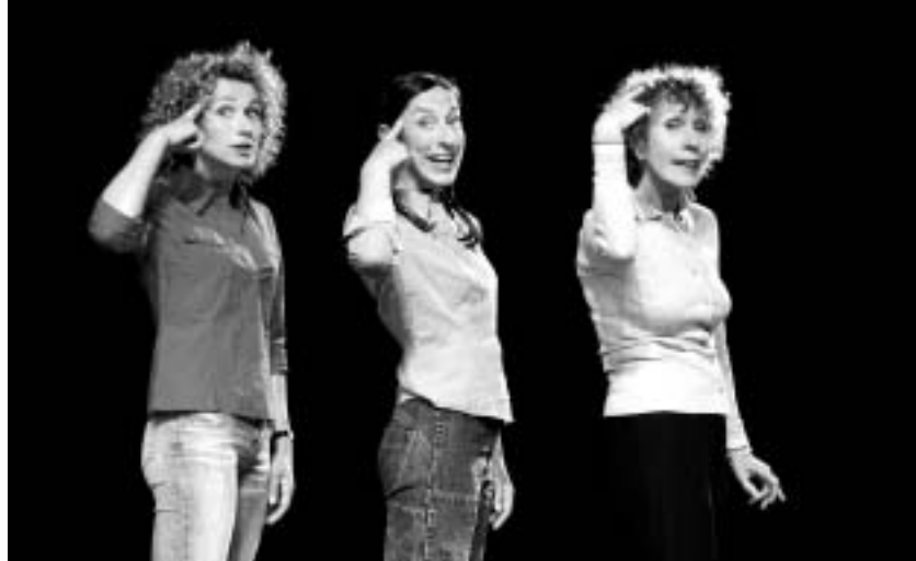
Le public a apprécié la performance des trois actrices

Les auteures féminines des « 3 Jeanne » ont mis ces situations en exergue sans jamais - ce sont elles qui le disent dans la pièce - sombrer dans le MLF où les Chiennes de garde. D'ailleurs, le spectateur observe un savant dosage où les « mecs » sont visés avec pour réponse astucieuse, un satirique « flinguage » des « nanas ». Le public adhère et rit parce qu'il retrouve sur scène, ce qu'il a connu et enduré un jour où l'autre dans sa propre vie. La salle, jeudi soir, était bondée de grappes de jeunes femmes et de couples d'âge mûr. Chacune