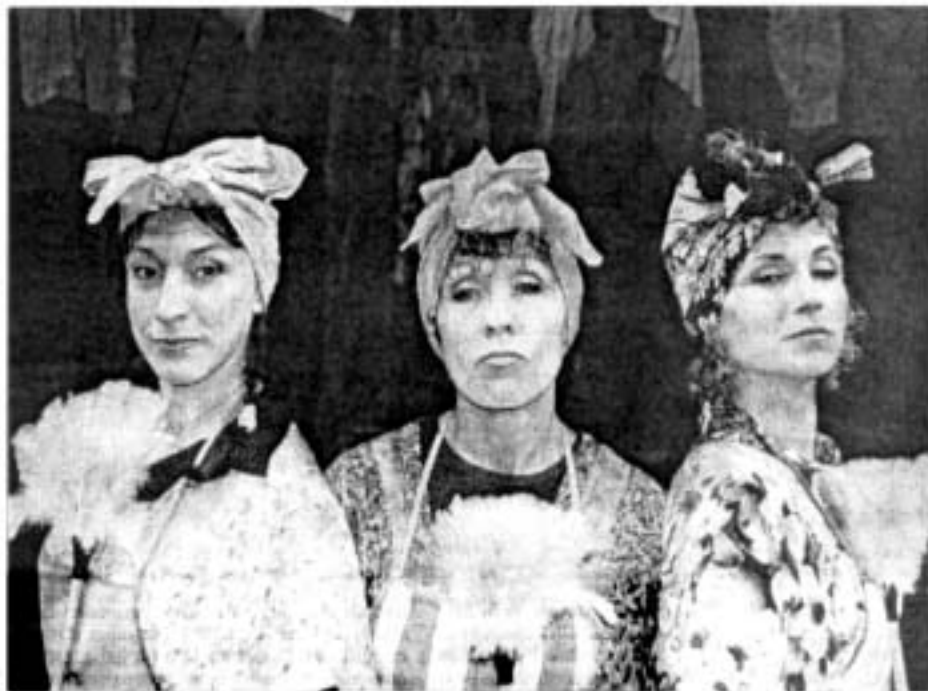
"Les Trois Jeanne" ont fait un tabac pour leur retour à Forcalquier.

Chasseuses sachant chasser, elles tirent sur tout ce qui n'a pas